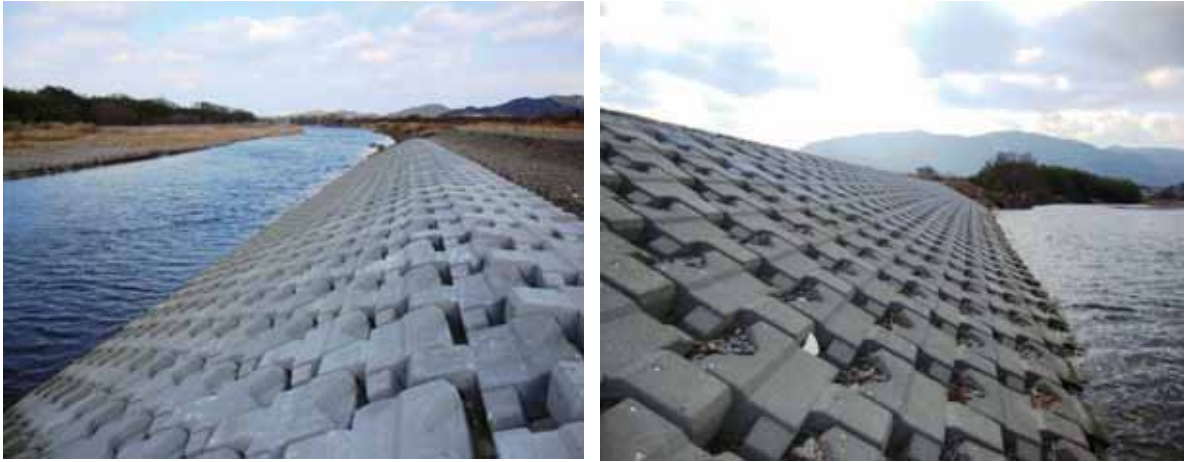
施工場所：徳島県 勝浦川（平成 25 年度施工）