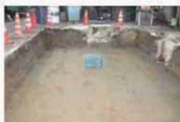
敷設面のチェック