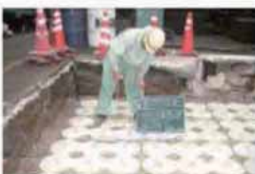
間詰碎石の充填確認