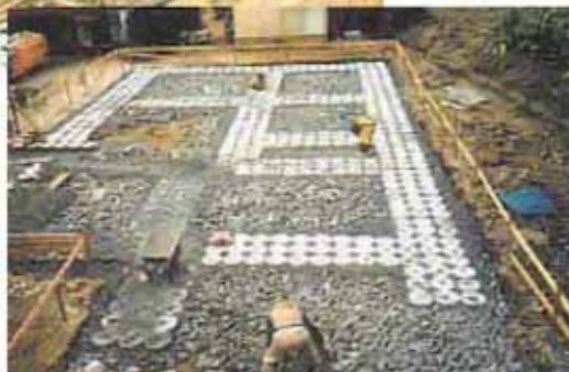
低・中層建築物の基礎