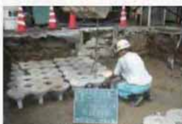
コマ型ブロック敷設