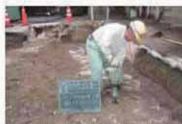
間詰碎石の充填・締め固め