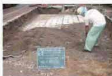
間詰碎石の充填・締め固め