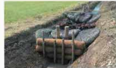
他の濁水処理工法と併用