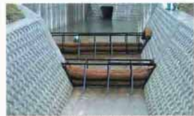
コンクリート護岸の都市河川での使用