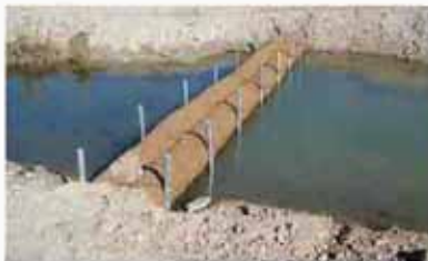
河川へ流出する手前での濁水対策