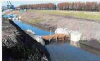
狭い排水路や小河川などの濁水対策

バイオログナチュラルフィルターは現場条件に合わせて、様々な施工方法で使用されています。